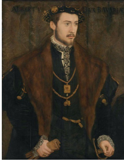
الصورة رقم (٢)

والمكتبة الثانية من هذه المكتبات هي مكتبة ولاية بافاريا في (ميونخ)، تأسست في بداية الأمر بوصفها مكتبة محكمة ميونخ Münchener Hofbibliothek، على يد الدوق ألبريشت الخامس Albrecht V Herzog [الصورة رقم (٢)]، عام ١٥٥٨م، وهي تمتلك حاليًا (٤٢٠٠) مخطوط إسلامي [الجدول رقم (٢)] (١٦) . إنَّها ثاني أكبر مكتبة في ألمانيا في مجال اهتمامنا، لا أقصد من حيث الأعداد التي تضمُّها فحسب.