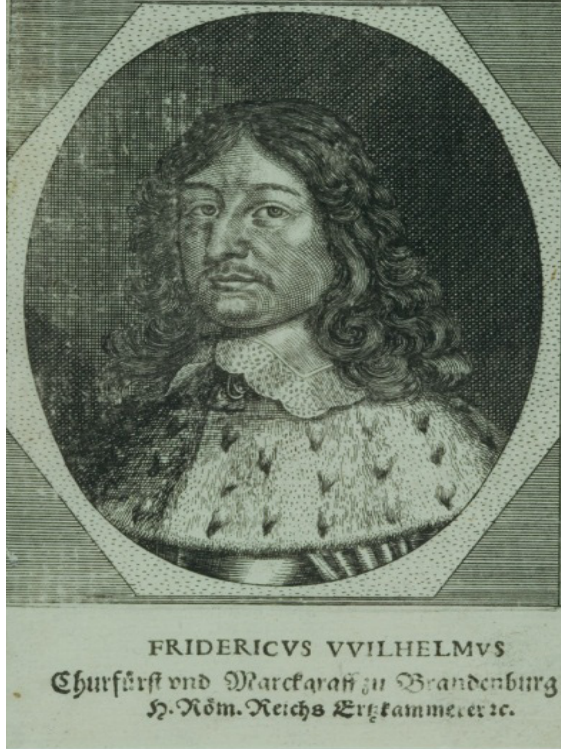
الصورة رقم (١) فريدريك يلهلم، أمير ناخب (حاكم) براندنبورغ (١٦٢٠-١٦٨٨م) نقش نحاسي من القرن السابع عشر.

ولقد تأسست مكتبة ولاية برلين في عام ١٦٦١م، وكانت تحمل اسم Churfürstliche Bibliothek zu Cölln an der Spree، عن طريق فريدريك يلهلم Friedrich Wilhelm [الصورة رقم (١)] بولاية براندنبورغ Brandenburg - الذي كان يُلقَّب بـ«الأمير الناخب العظيم» Der Große Kurfürst.