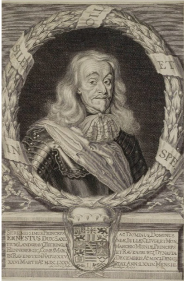
الصورة رقم (٣) إرنست الأول، دوق ساكسن جوتا وساكسن ألتينبرج (١٦٠١-١٦٧٥م) نقش نحاسي لياكوب فون ساندراوت (Jacob von Sandrart)، عام ١٦٧٧م.

وقبل الحديث عن تاريخ عمليات الاستحواذ على المخطوطات التي قامت بها مكتبة جوتا للأبحاث، ينبغي لي أولاً توضيحُ الموقع الجغرافي لمدينة (جوتا). إنَّها مدينة صغيرة في منتصف الطريق بين مدينتي إرفورت Erfurt وأيسناخ Eisenach، بولاية تورينجن Thuringen بوسط ألمانيا. ولا تدين شهرتها إلى كُتَيْب (أنساب النبلاء الأوربيين) - الذي نُشِرَ أوَّل مرَّة هناك - فحسب، بل إلى أنَّها كانت مقرّاً لدوقية ساكسن جوتا Sachsen-Gotha، خلال المدة من ١٦٤٠ إلى ١٩١٨م. وكان القصرُ الجديدُ للدوق إرنست الأول Ernst I [الصورة رقم (٣)] - وكان يُسمَّى «قصر السلام» Schloss Friedenstein - مقرّاً للمكتبة القصر، منذ تأسيسه عام ١٦٤٧م.